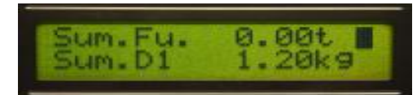
Beispiel Datenspeicher Anzeige

Diese Technik gibt dem Nutzer und/oder auch dem Veterinär somit die Sicherheit, Medikamente und andere Zusatzstoffe verantwortungsvoll zu verabreichen.