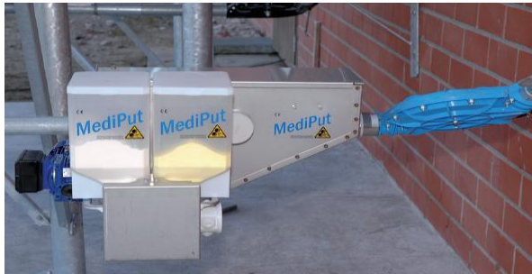
Seitenansicht MediPut an Außenanlage ohne Abdeckung

Bei dem computergesteuerten Dosiergerät MediPut mit Mengennmessung (MM) handelt es sich um ein innovatives System zur exakten Dosierung von trockenen und flüssigen Zusatzstoffen in Trockenfütterungsanlagen.